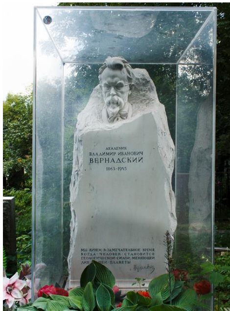
Рисунок 2. Могила В.И. Вернадского, украшенная скульптурой.

«Нет ничего сильнее жажды познания, силы сомнения. И это искание, это стремление — есть основа всякой ученой деятельности... ищешь правды, и я вполне чувствую, что могу умереть, могу сгореть, ища ее, но мне важно найти, и если не найти, то стремиться найти ее, эту правду, как бы горька, призрачна и скверна она ни была!» из письма В. И. Вернадского.