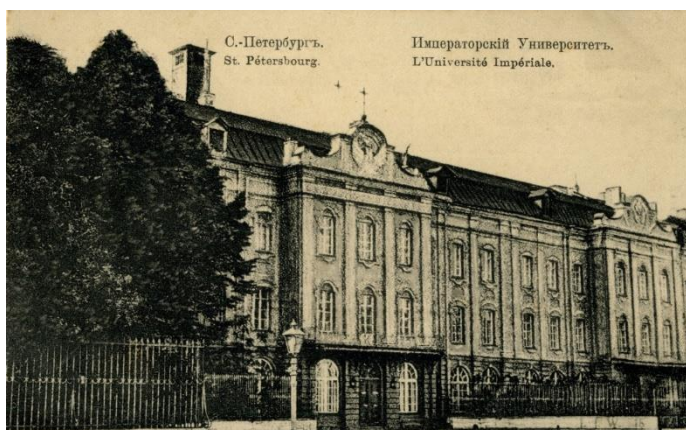
Рисунок 1. Здание Императорского Санкт-Петербургского Университета XIX век.

Бекетова, Меншуткина, Костычева, Воейкова, Фандерфлита, Петрушевского, Богданова, Вагнера. Всё моё университетское прошлое оказало решающее влияние на мою жизнь» [1].