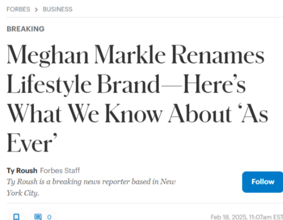
Pic 1. Article about Meghan Markle's rebranding in Forbes magazine.