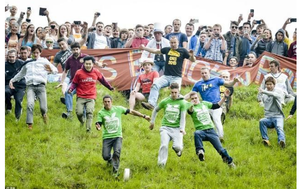
Pic. 2. Cooper's Hill Cheese-Rolling and Wake.

On the other hand, in this way people confirmed their right to use communal land for grazing their flocks. The essence of the competition boils down to the fact that a head of local Gloucester cheese is launched from the top of the hill, after which the participants of the race rush in pursuit. Whoever catches a cheese head gets it as a reward and becomes the winner. However, the race for cheese is a rather traumatic activity, so in 2013, for safety reasons, the cheese was replaced with a foam copy [6].