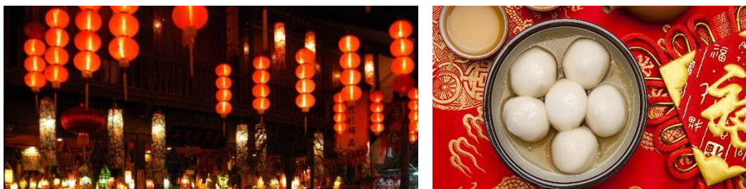
Pic. 5. A lot of lanterns are lit during the holiday, and the Chinese are preparing a national dish – yuanxiao.

The representative of China, Zed, wrote about the traditional dish on this holiday. “The main dish of the holiday is yuanxiao or balls of glutinous rice served with sweet filling or candied fruits. They have the shape of a ball and symbolize the happiness of a family.”