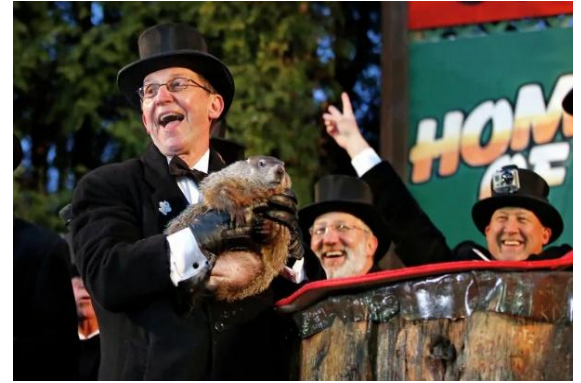
Pic. 3. Groundhog Day in the USA.

It is believed that if an animal sees its shadow, gets scared of it and hides back in its hole, then winter will last for another six weeks. If he fearlessly goes outside, then warm weather is coming.