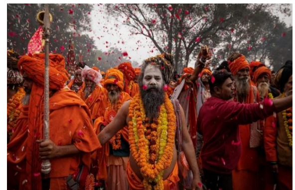
Pic. 4. Kumbha Mela 2025 in Prayagraj.

“The beginning of the Kumbha Mela is marked by a magnificent procession, with representatives of akharas (traditional Hindu monastic organizations that combine spiritual and martial disciplines) performing at the opening. Heads of religious organizations ride elephants, horses and chariots through the streets of the city, blessing the guests of the festival.”